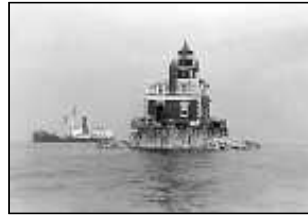
Stepping Stones Light stod klar 1877 vid Kingsport i staten New York. Än i dag är fyren aktiv och tjänstgör som hjälpmedel för sjöfarten.