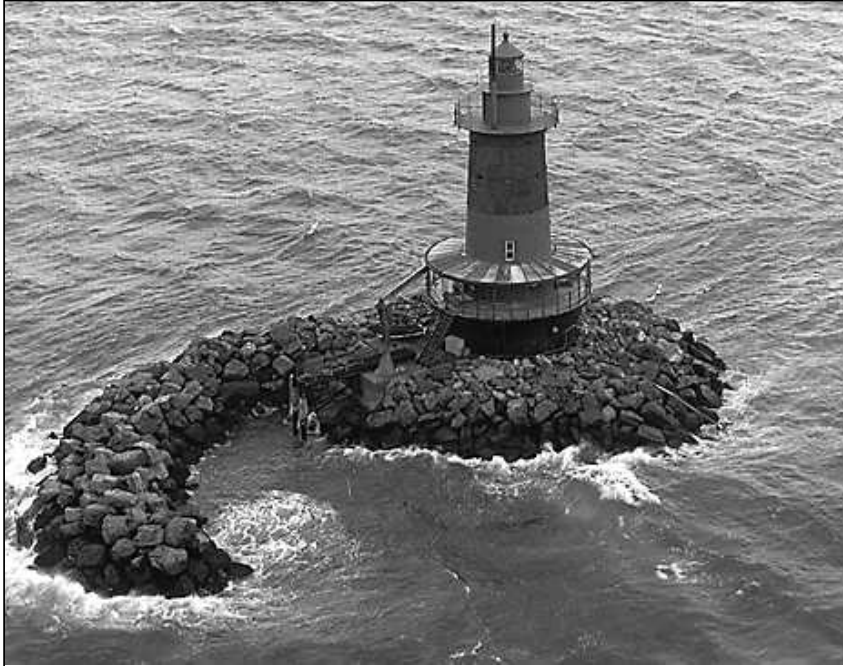
Westbank Light vid Staten Island tändes första gången 1901 och har sedan dess varit hjälpmedel för fartygen på Atlanten.