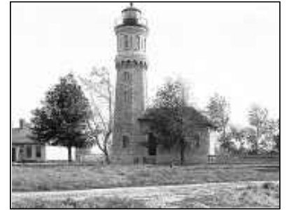
Fort Niagara Light tändes första gången 1872. Fyren står vid Lake Ontario vid staden Youngstown. Används i dag som museum.