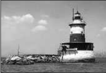
Robbins Reef Light invigdes 1883 och finns på Staten Island. Fyren fungerar fortfarande som äkta fyr men är sedan 1966 automatiserad.