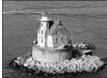
Race Rock Light står vid Fisher Island i staten New York. Fyren automatiserades 1978 och används än i dag av sjöfarten.