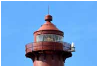
Lanterninen, Slettnes fyr

Om vi ändå begrundar fyrbyggnationskonsten: