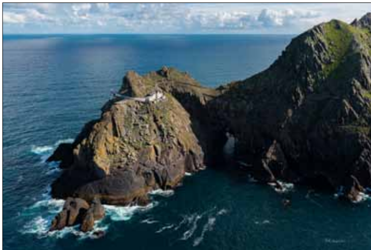
På den västra delen av Tearaght Island byggdes fyren och fyrvaktarbostäder. Notera den naturliga "tunneln" i mitten.

När fyren sedan kom i drift 1870 tjänstgjorde två väktare och deras familjer på ön. 1881 var det som mest folk, 13 personer, inkl. 9 barn. Man kan tänka sig vilka förhållningsregler som gällde för barnen när de rörde sig på ön. Vid stormigt väder hölls barnen inomhus.