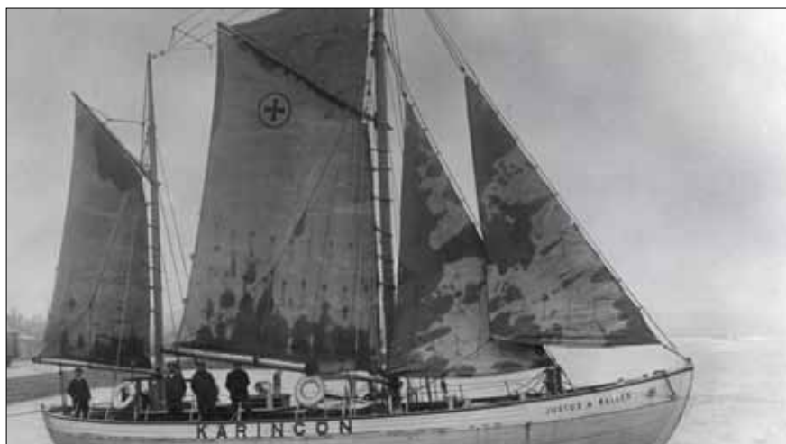
Livräddningsbåten Justus A Waller.

Det andra vraket är den engelska skonerten Macalla. Hon grundstötte sydost om Karingön i en orkanartad storm i december 1929. Besättningen och kaptenens familj räddades under mycket dramatiska omständigheter av sjöräddningen på Karingön som hade livräddningsbåten Justus A Waller till hjälp. Räddningsbåten var byggd tio år tidigare på Fridshems varv i Lysekil.