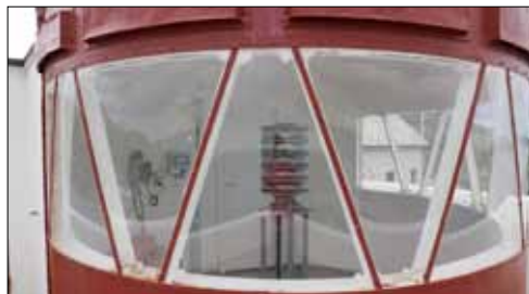
Lanterninen på Bøkfjords fyr

Jag företog min resa från öst till väst och började med besök vid Bøkfjord Fyr. Till fyren leder en drygt 11 kilometers vandring från Reinøysund med totalt över 400 meter uppåt och neråt, i varje riktning. På vägen till Reinøysund passerar man inom skotthåll för ryska prickskyttar vilket kändes otäckt. Efter nästan fyra timmars vandring, efter att ha passerat sista krönet, ser man fyrplatsen liggande vid ens fötter vid glittrande Bøkfjord. Hur ofta ser man en hel fyrplats från fågelperspektivet? Bøkfjord fyr är belägen på en sluttning c:a 25 meter över havet. Den nyrenoverade fyren består av en röd lanternin ovanpå ett vitt maskinhus omgiven av fyrpersonalens bostäder,