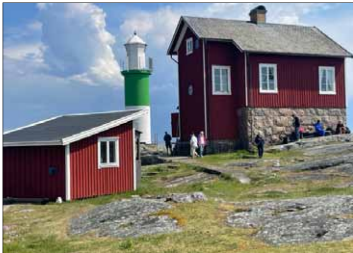
Valö fyrplats i Göteborgs södra skärgård.

Söndagen den 14 maj samlades ett tjugotal fyrvänner på Saltholmens brygga. Vi var förväntansfulla för vi skulle få komma till Valö; en ö som flera av oss aldrig besökt.