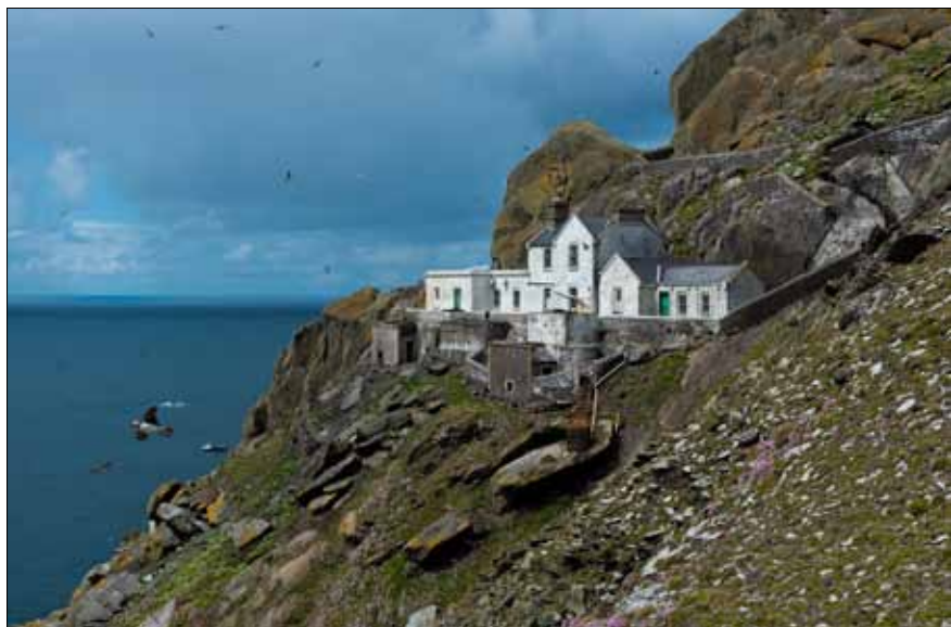
Fyrvaktarbostäder. De ligger på en höjd av c:a 75 meter.