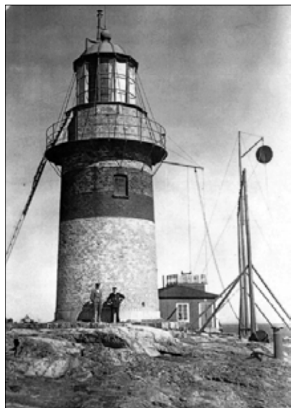
Brämöns gamla fyr med signalställning och maskinhus.

Det var under första hälften av 1960-talet, som jag jobbade som fyrvaktare på Brämön. Det är c:a 60 år sedan och många detaljer har nog fallit ner i glömskans djupa vrår, men jag ska försöka att väcka dem till liv.