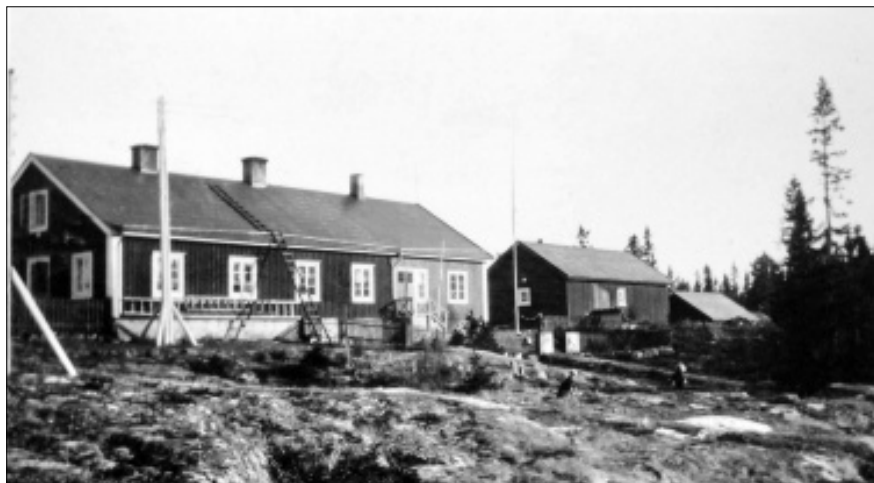
Bremöns fyrvaktarbostäder, 1926