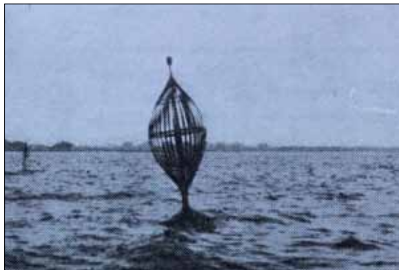
Röderprick då bojen låg i inloppet.

Detta iögonfallande sjömärke sågs under många år vid huvudrännans yttre ände ost om farleden in till Malmö hamn. Många resenärer mellan Malmö och Köpenhamn observerade säkert detta ovanliga märke när en friterad spätta eller en utsökt köträtt intogs under överfarten. Några gäster hade som tradition att sänka de två första snapsarna innan man passerat Röderprick på utvägen.