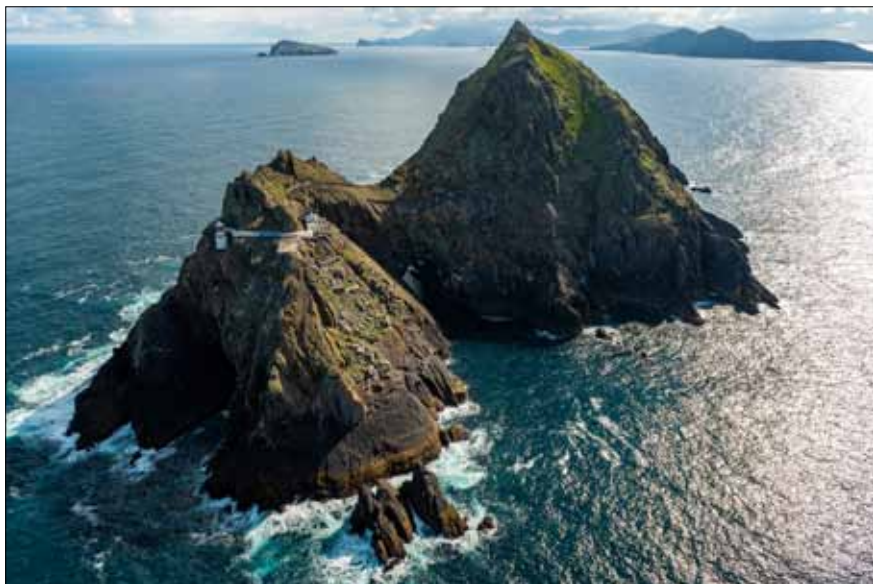
Tearaght Island. På den västra delen, vars höjd är 116 meter, byggdes fyren och fyrvaktarbostäder. De stod klara 1870.