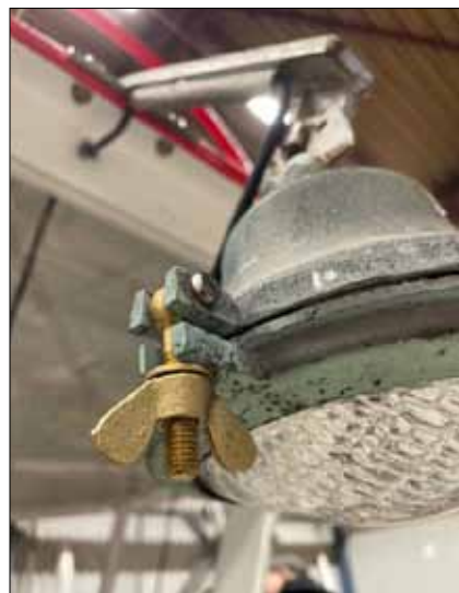
Alla löstagbara delar renoverades och kompletterades med bl a nya glas och skruvar.