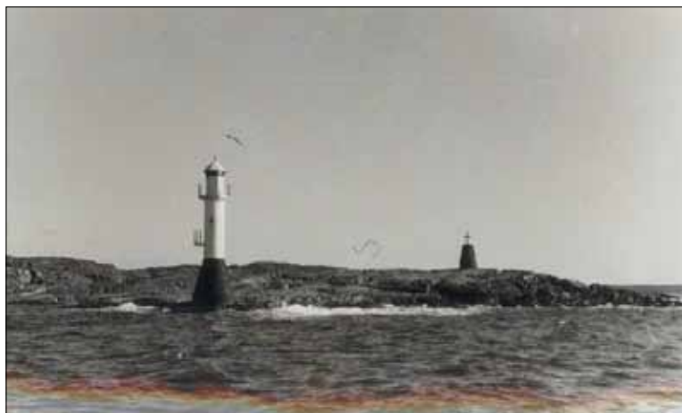
Kråksundsgap södra på Bråtö år 1954.

I ett drygt halvsekel stod den på Bråtö i det beryktade Kråksundsgap. Den gången var det Sjöfartsverket som underhöll den, nu är det Lysekils Vänner, med många goda kontakter och ekonomiskt stöd från Lysekils kommun.