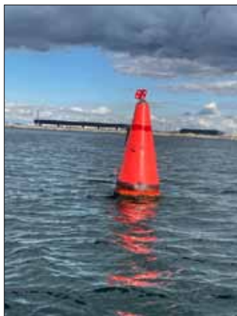
Den nya Röderprick har nu intagit samma position som den gamla bojen hade.