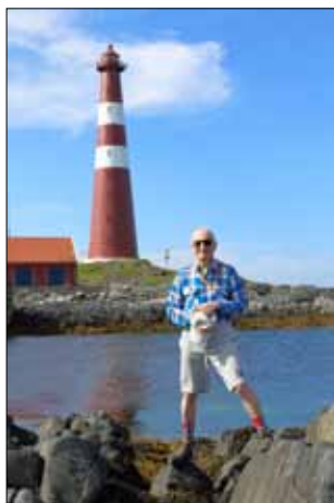
Författaren vid Slettnes fyr

Det är sex fyrplatser som ligger längs de norska stränderna av Barents Hav, österifrån är det Bøkfjord, Vardø, Makkaur, Kjølnes, Slettnes samt Helnes, vilka anlades mellan 1896 och 1928. Under 2:a världskriget ockuperades dessa fyrplatser av Hitlers trupper, fyrarna var strategiskt viktiga och skulle vägleda tyska transporter av järnmalm från Kirkenes (krigsindustrin krävde mycket stål) och absolut inte underlätta för de allierades konvojer med vapen till Sovjet via Murmansk.