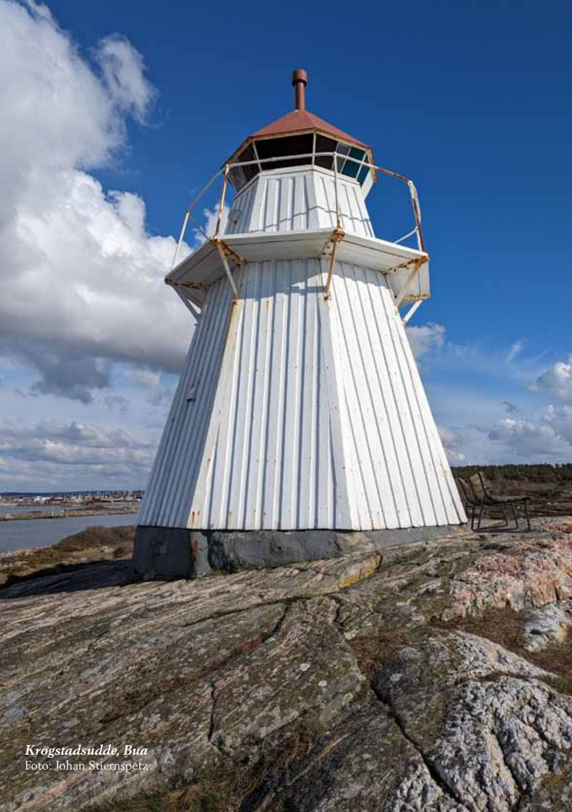
Krogstadsudde, Bua