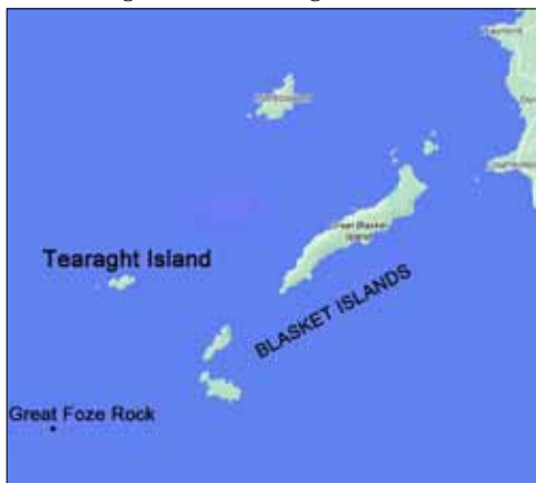
Tearaght Island i ögruppen Blasket Islands.. Great Foze Rock ca 5 km åt sydväst.