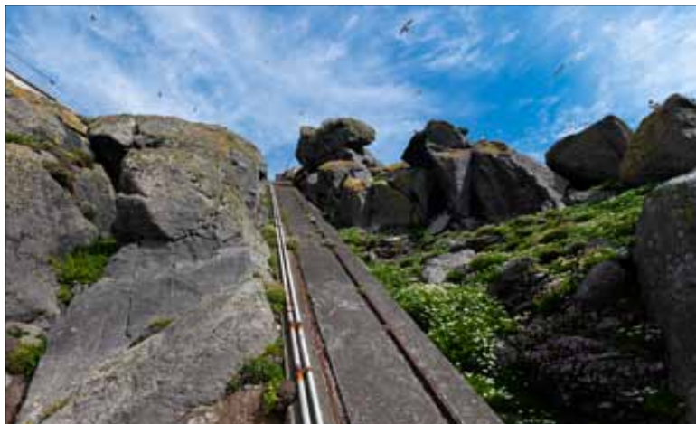
Resterna av bergbanan.

1913 anlades en bergbana på den södra landningsplatsen. Irländare är stolta över denna, dels för att den byggdes på en så spektakulär plats, dels för att den sägs vara den brantaste bergbanan i Europa. Vagnarna drogs från början av en tryckluftsdreven winch, som senare ersattes av en winch driven av en dieselmotor. Idag finns bara själva banan i cement kvar.