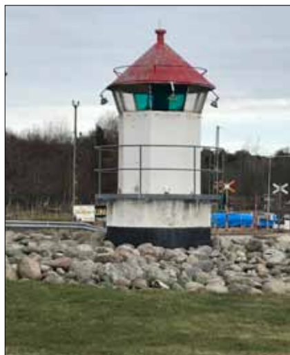
Efter 13 år i rondellen var fyrkuren i stort behov av underhåll