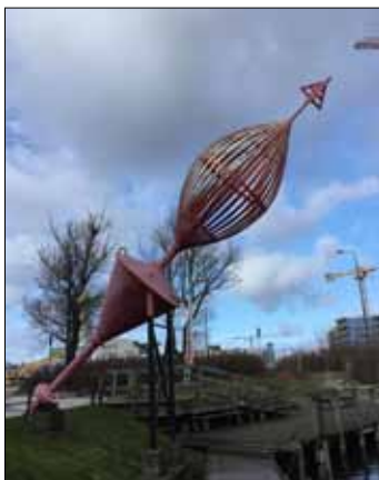
Gamla Röderprick har idag sin plats intill fiskarhoddorna i Malmö hamn i närheten av Sjöfartsmuseet.

Enligt SVENSK fyrlista 1988 var Röderpricks position 55°38' N ; 12°59' O. En röd babordsboj utplacerad år 1903 och utbytt enligt gällande utprickningsregler 1987 är försedd med rött ljus av karaktären Q R och radarreflektor.