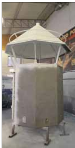
Fyrkuren strippad på alla delar, blåstrad och grundmålad.