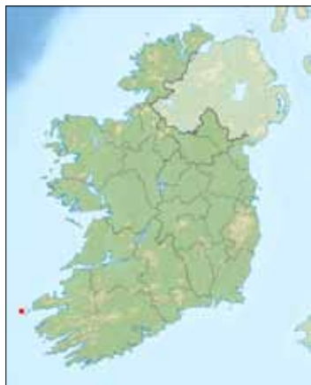
Tearaght Island markerad med en röd punkt.

Om vi bortser från Azorerna så är ön Tearaght Island, belägen i ögruppen Blasket Islands utanför Irlands västra kust, Europas västligaste punkt, bortsett från några klippor något längre bort åt sydväst. Tearaght Island ligger på longituden 10^{\circ} 39' 4'' W. Ön är bara 0,4 kvadratkilometer stor och dess högsta punkt är 200 meter över havet. Ön har en av Irlands största kolonier av lunnefåglar och stormfåglar.