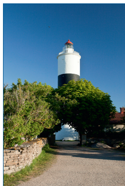
Ölands Södra Udde