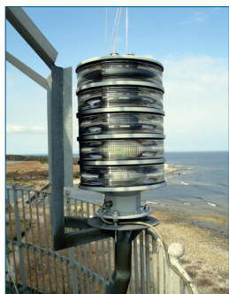
Nuvarande optik, Sabik LED 350, Ölands Norra Udde

Bilväg brofästet Öland - Ölands Norra Udde c:a 96 km. Kör väg 126 norrut till udden. Parkera och promenera 5 minuter till fyren.