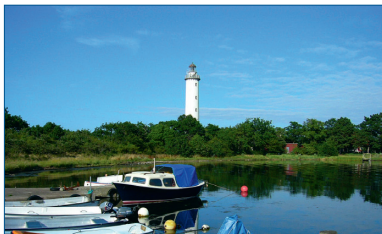
Ölands Norra Udde