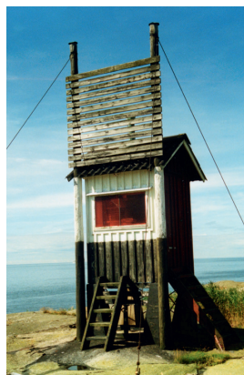
Vinga östra övre