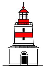
Ritat av Leif Elsby