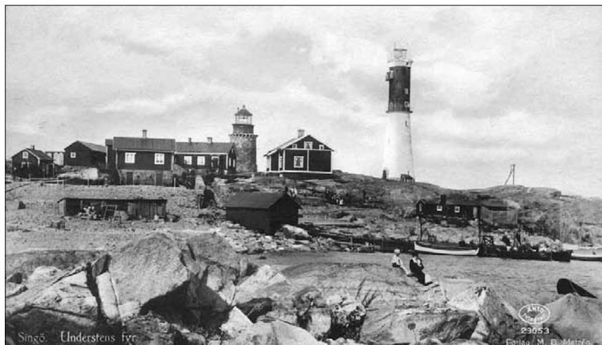
Understens fyrplats med den gamla och nya fyren.