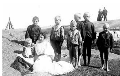
Skolfröken med barnen på Understen.

Fyrmästare Uddman hade problem med spriten och i lotsstyrelsens perso-